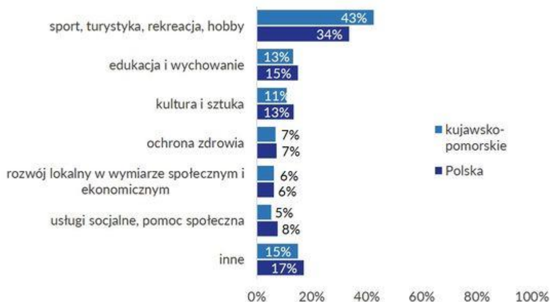
Wykres 1. Główne dziedziny działań kujawsko-pomorskich organizacji na tle ogólnopolskim

Źródło: https://publicystyka.ngo.pl/9-faktow-o-ngo-w-województwie-kujawsko-pomorskim , dane za rok 2016.