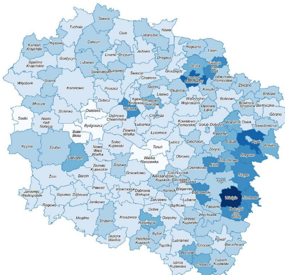
Mapa 3. Natężenie korzystania z zasobów pomocy społecznej w roku 2017

Natężenie korzystania z pomocy społecznej w gminach województwa kujawsko-pomorskiego w 2017 roku